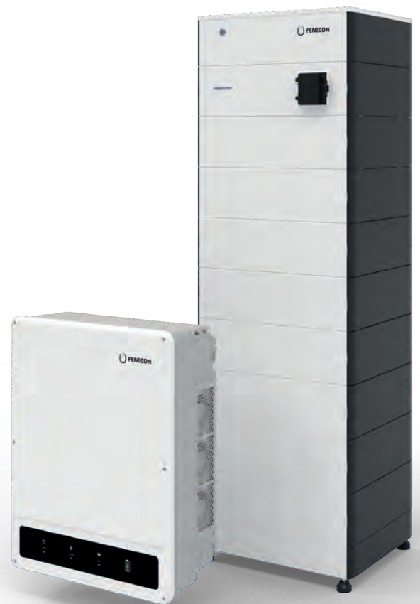
(22,4 kWh Systemvariante)